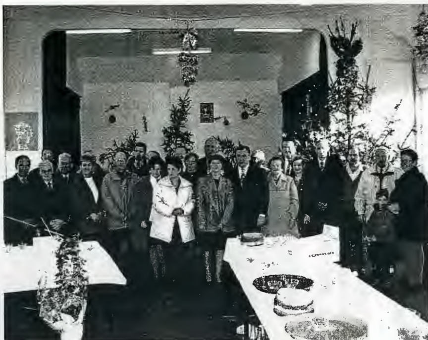
Bonne Année 2000