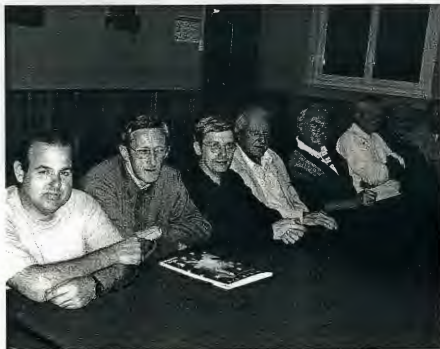
Conseil CCAS Comité réunis