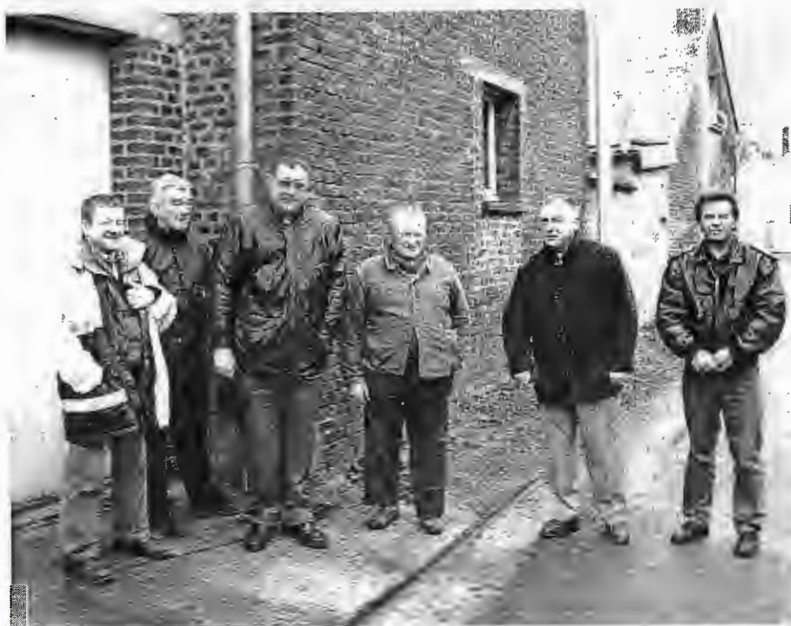
Préparation des travaux