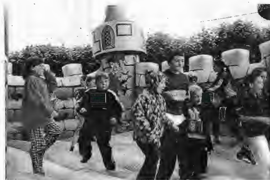
14 Juillet 2000