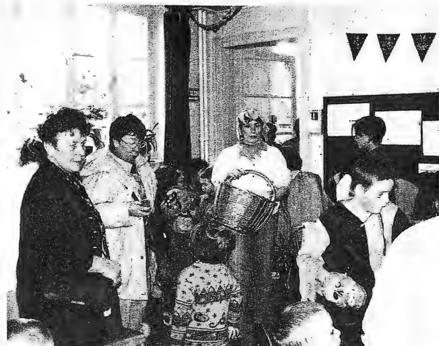
Enseignants, Parents et Enfants fêtent Halloween