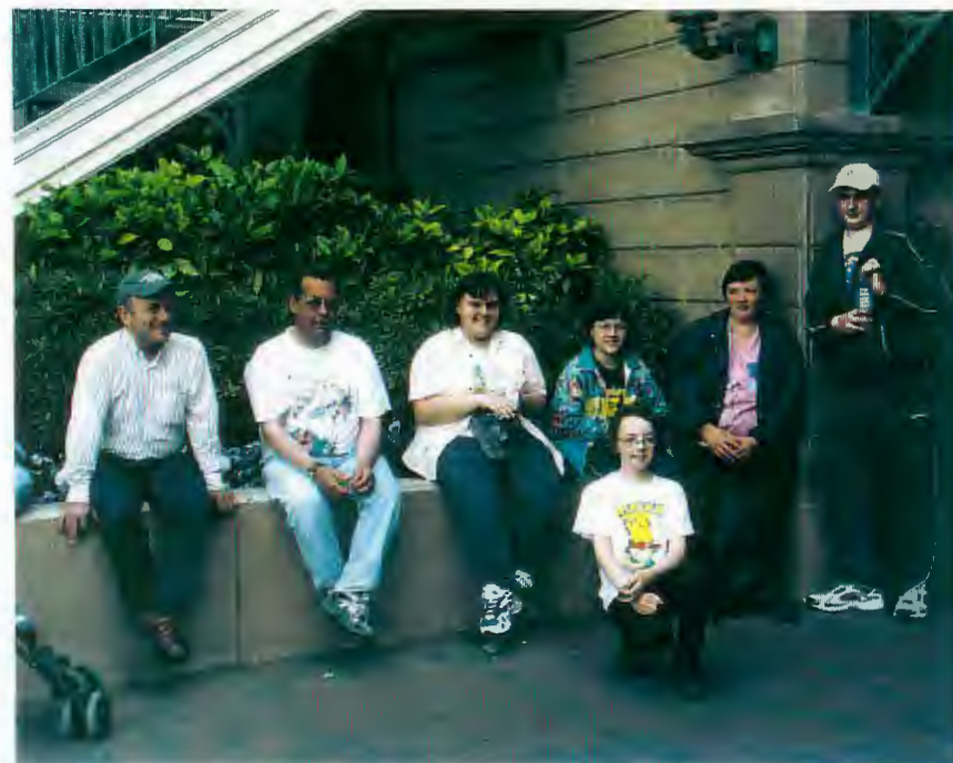
Les Forésiens à Eurodisney